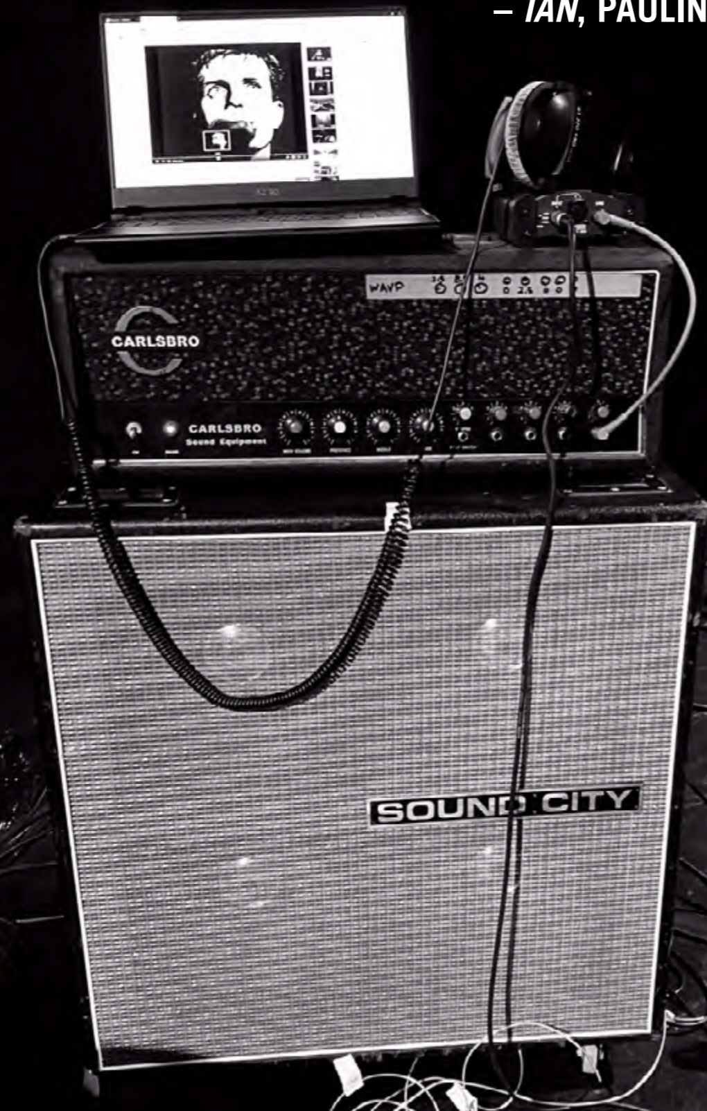
TABLEAU 8 – POST / PUNK / COLD / WAVE – IAN, PAULINE PICOT

« LE PUNK, C'EST FUCK YOU, LE POST-PUNK, C'EST I'M FUCKED. DE VA TE FAIRE FOUTRE À JE SUIS FOUTU. »