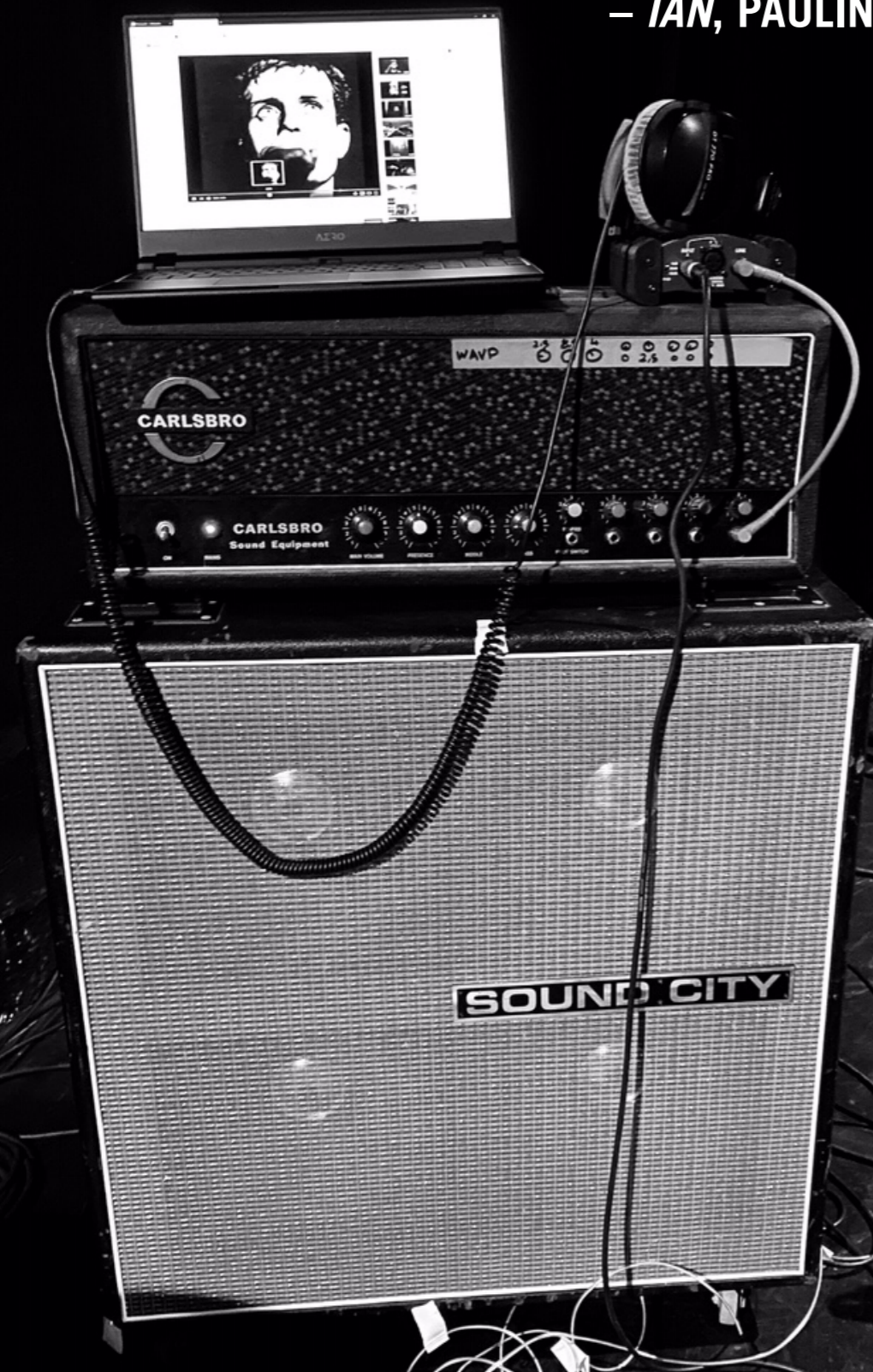
TABLEAU 8 – POST / PUNK / COLD / WAVE – IAN, PAULINE PICOT

« LE PUNK, C'EST FUCK YOU, LE POST-PUNK, C'EST I'M FUCKED. DE VA TE FAIRE FOUTRE À JE SUIS FOUTU. »